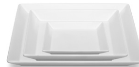
Plate flat Assiette plate Plato llano