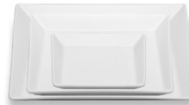
Plate flat asym. Assiette plate asym. Plato llano asim.