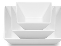
Plate deep asym. Assiette creuse asym. Plato hondo asim.